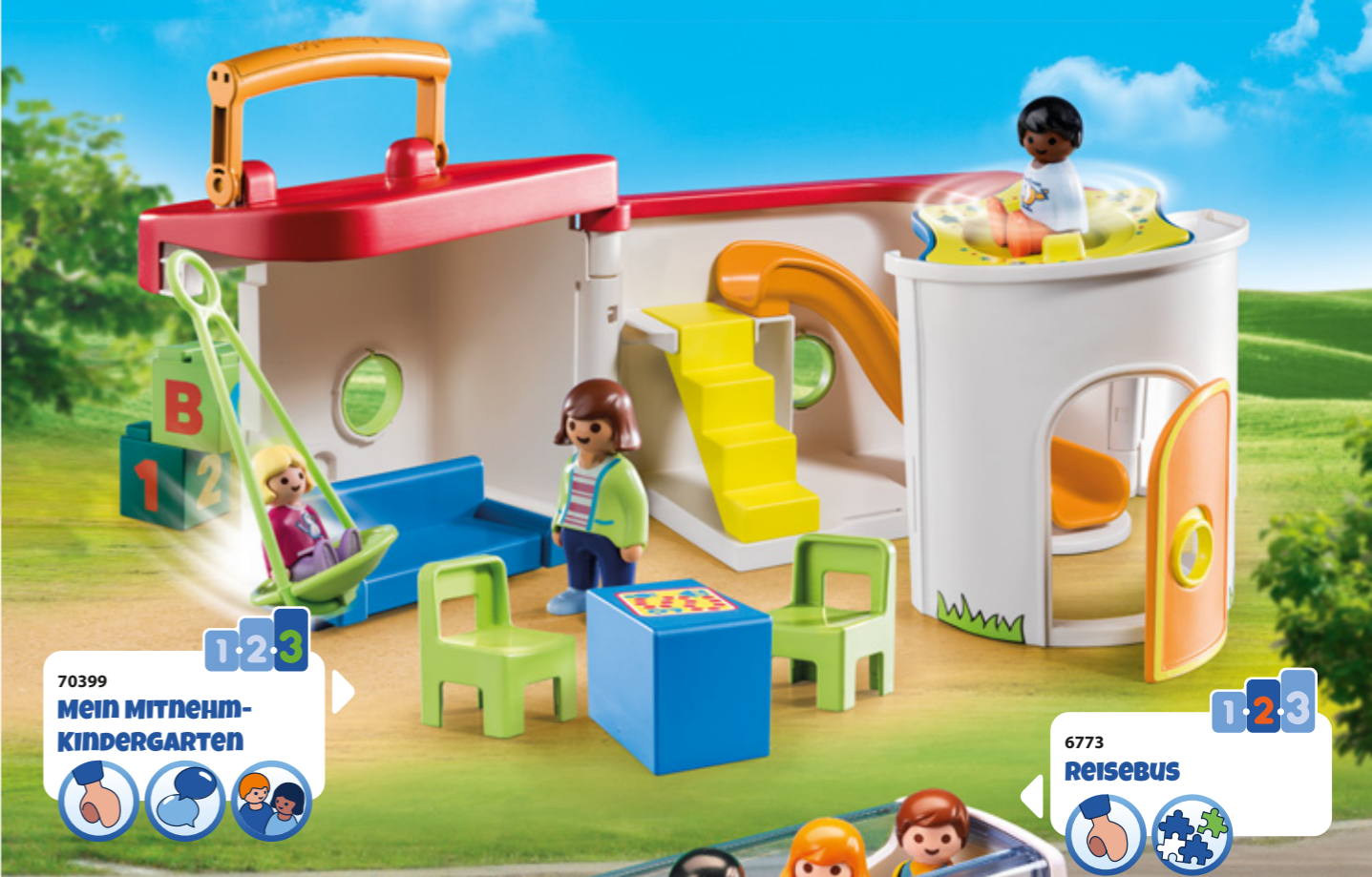
70399 Mein Mitnehm-KinderGarten