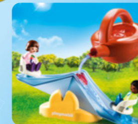
70269 WASSERWIPPE MIT GIEßKANNE