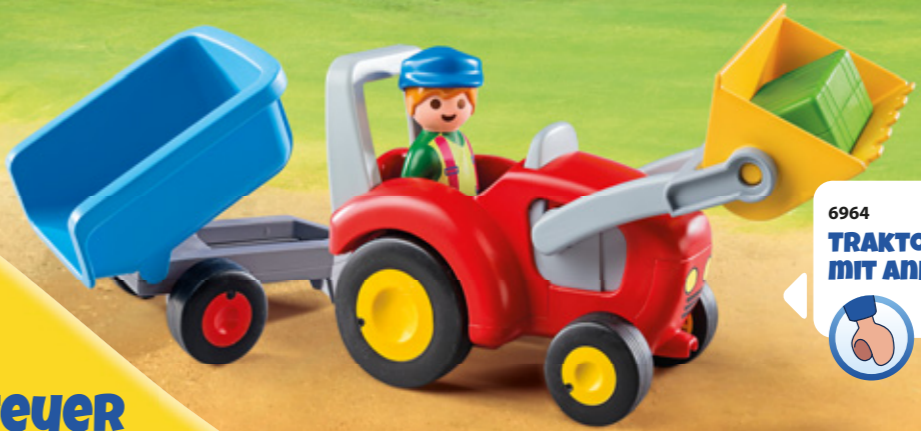
6964 TRAKTOR MIT ANHÄNGER