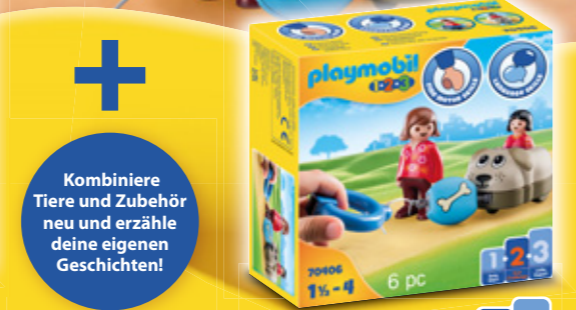
70406 Mein SCHIEBEHUND