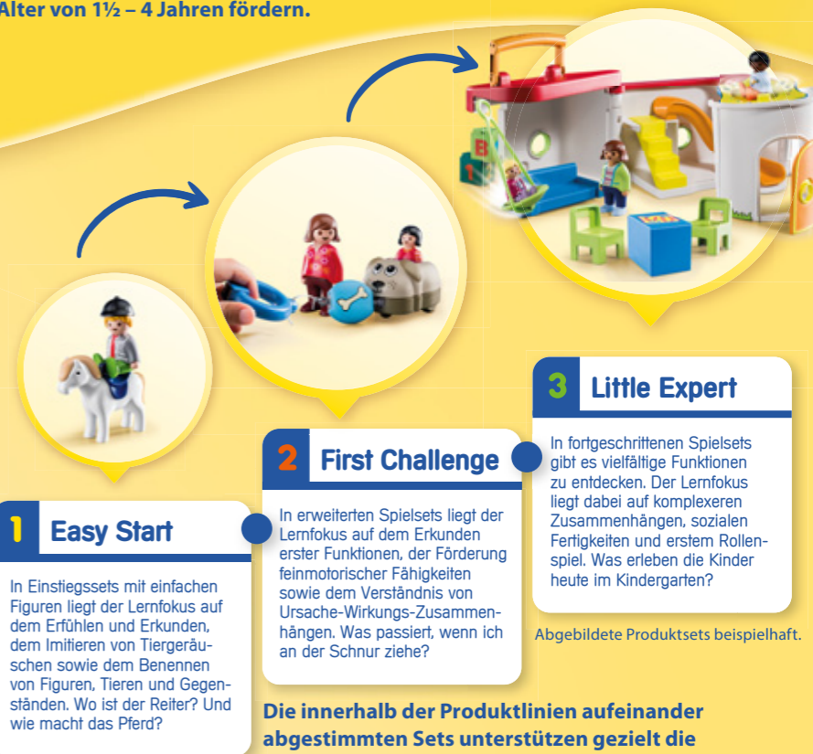
Abgebildete Produktsets beispielhaft.

Die Spielsets von PLAYMOBIL 1.2.3 sind in drei Lernstufen unterteilt und können so die Entwicklung des Kindes in den ersten Lebensjahren fortlaufend unterstützen. Durch neue Kombinationsmöglichkeiten und Ergänzungen innerhalb des Spielsystems sind die einzelnen Spielinhalte immer wieder spannend und wachsen über mehrere Jahre mit. Die Lernstufen Easy Start , First Challenge und Little Expert bauen aufeinander auf und sind für Eltern eine Orientierungshilfe.