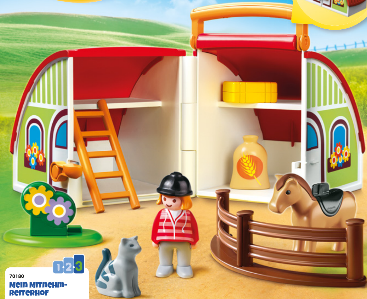
70180 MEIN MITNEHM- REITERHOF