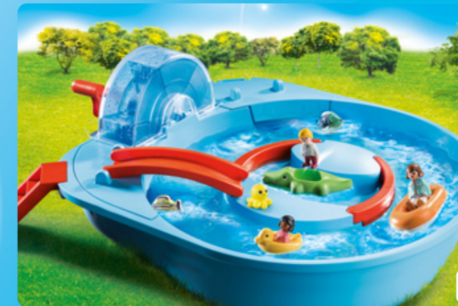
70267 FRÖHLICHE WASSERBAHN