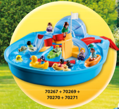
70267 + 70269 + 70270 + 70271