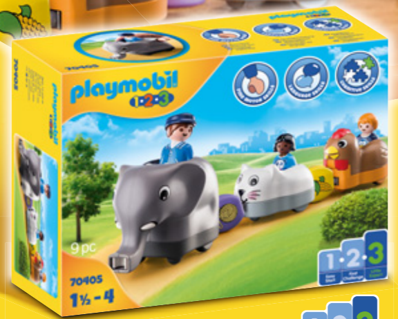
70405 Mein SCHIEBETIERZUG