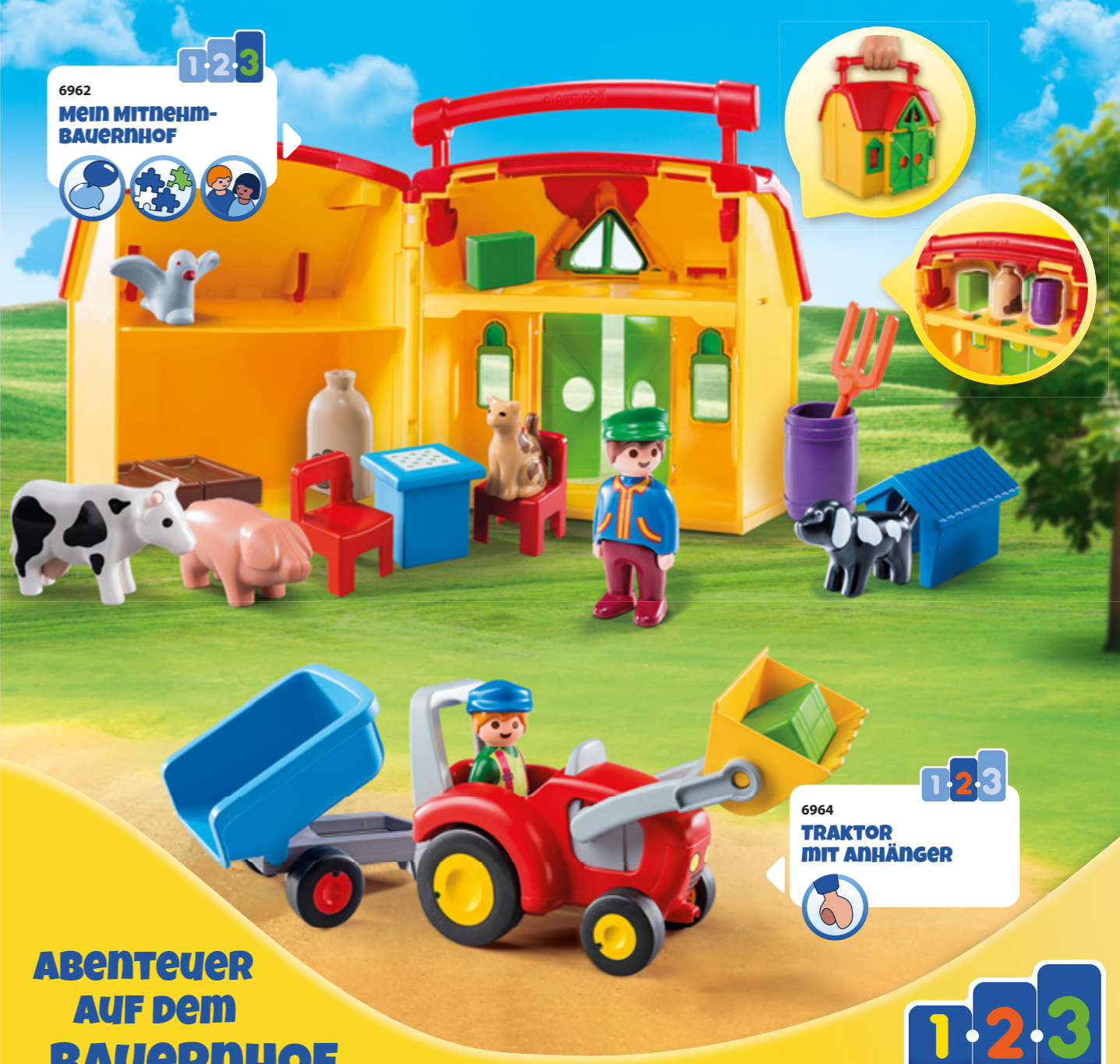
6962 Mein MITNEHM-BAUERNHOF