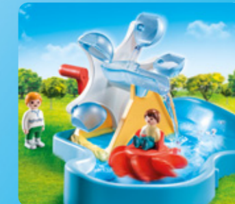
70268 WASSERRAD MIT KARUSSELL