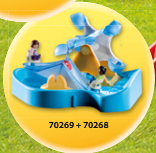
70269 + 70268