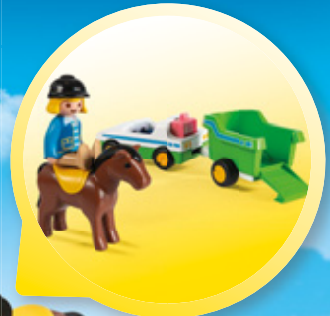
Neu ab Ende September 70410 JUNGE MIT PONY