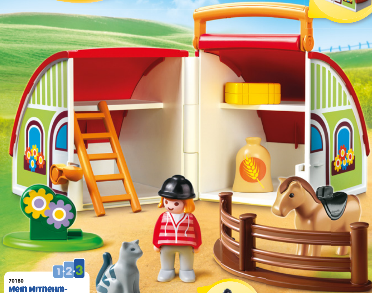
70180 MEIN MITNEHM-REITERHOF