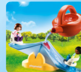
70269 WASSERWIPPE MIT GIEßKANNE