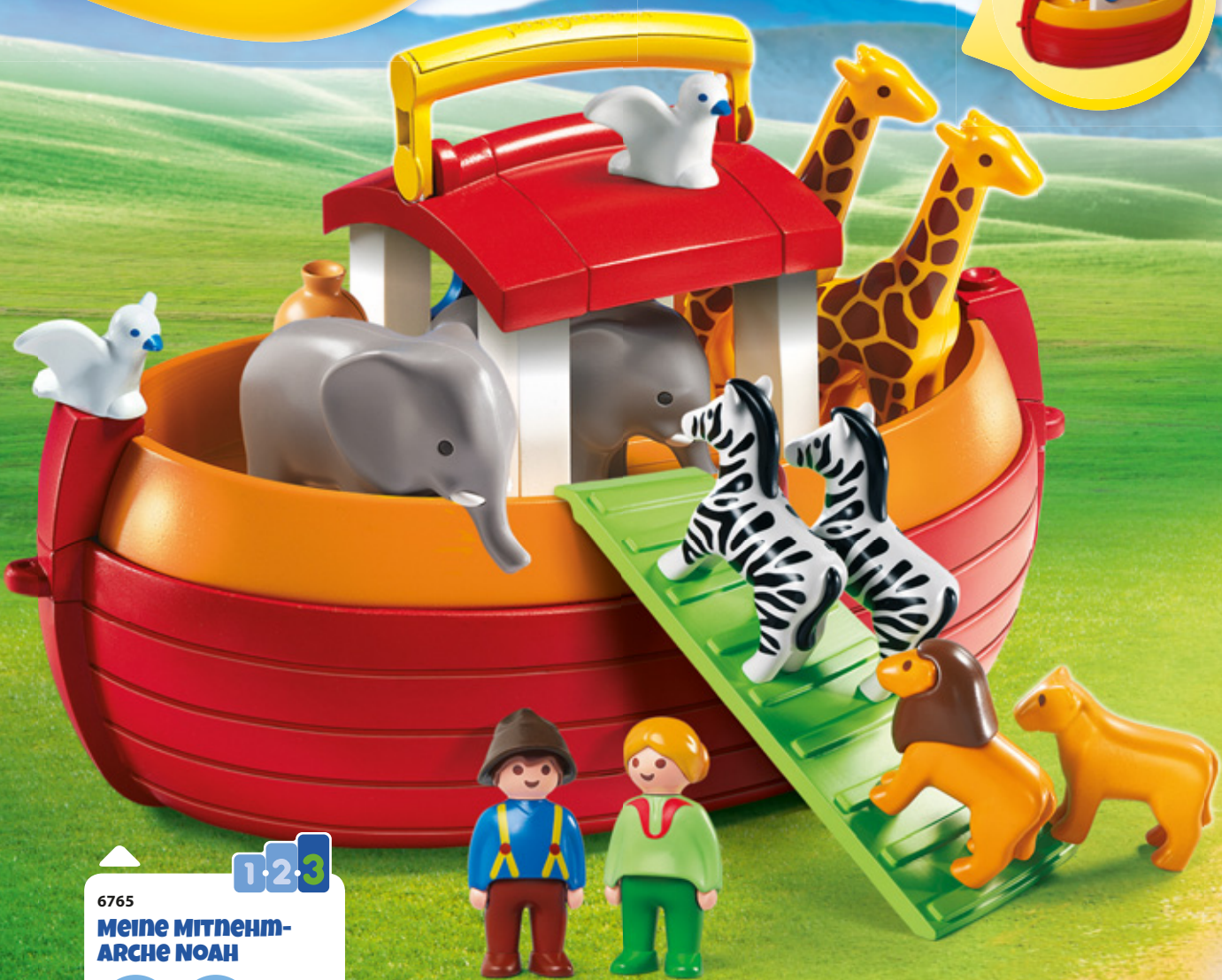
6765 Meine MITNEHM- ARCHE NOAH