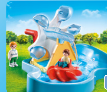
70268 WASSERRAD MIT KARUSSELL